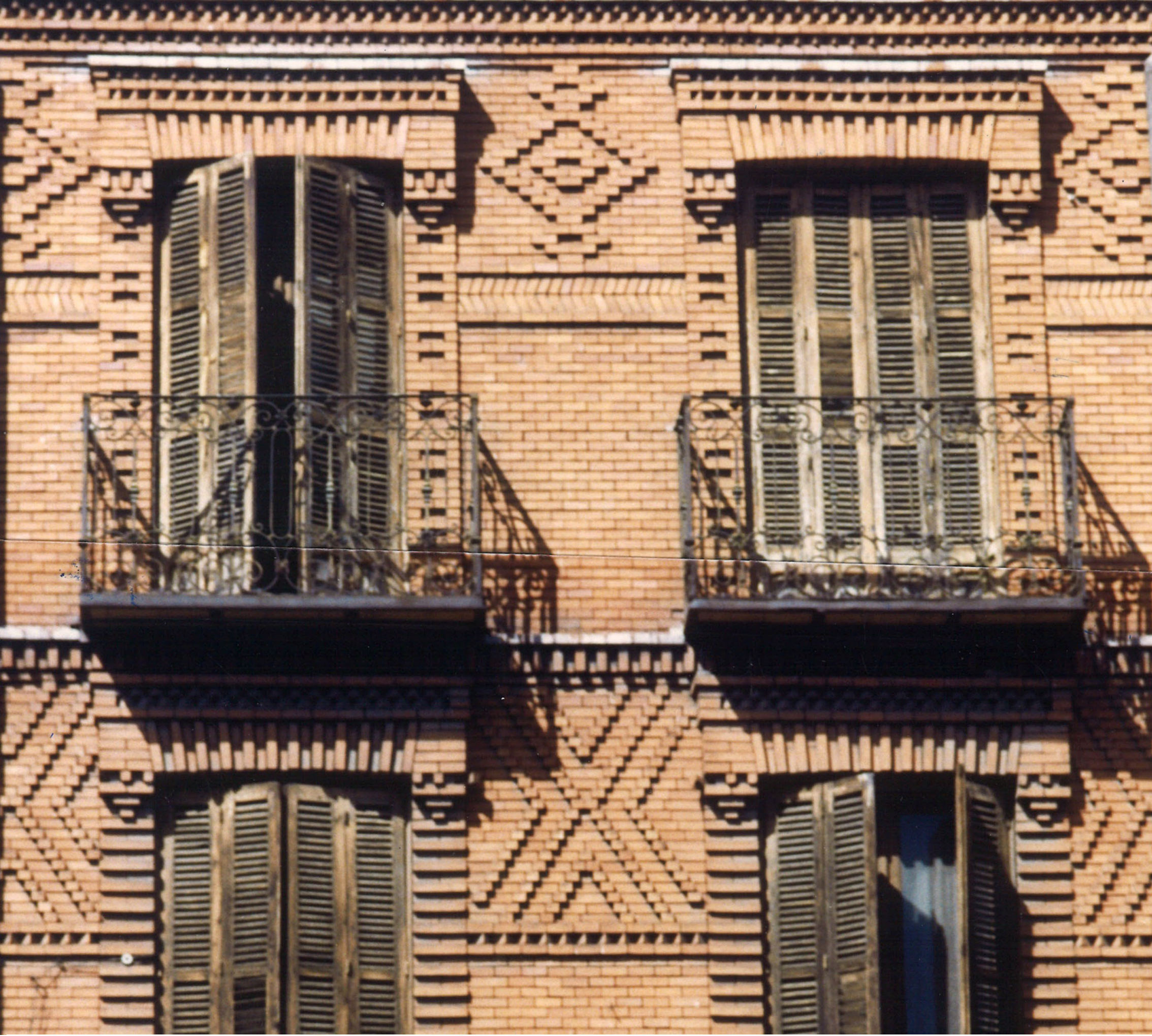
Plaza de la Fuente Dorada de Valladolid. Camino-1988